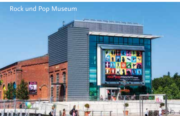
Rock und Pop Museum

Folgende Varianten stehen zur Verfügung: